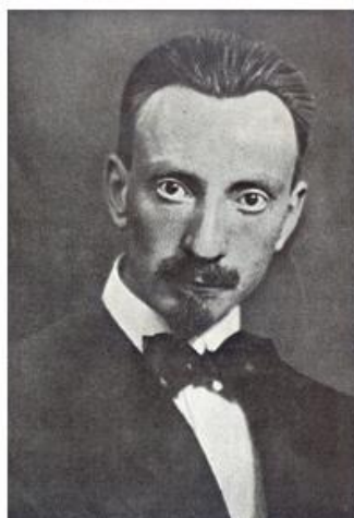
Luigi Russolo (Portogruaro, 30 aprile 1885 – Laveno- Mombello, 4 febbraio 1947)