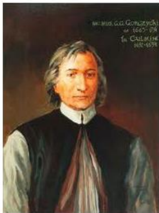
Grzegorz Gorczycki (Rossberg, 1665 circa – Cracovia, 30 aprile 1734)

IL QUOTIDIANO DELLE ARTI Per ogni OGGI , molti IERI Anniversari e prime esecuzioni