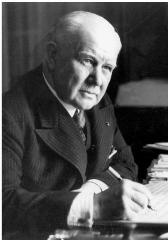
Franz Lehár (Komárom, 30 aprile 1870 – Bad Ischl, 24 ottobre 1948)