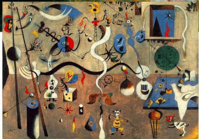
Joan Miró Barcellona, 20 aprile 1893 Palma di Maiorca, 25 dicembre 1983