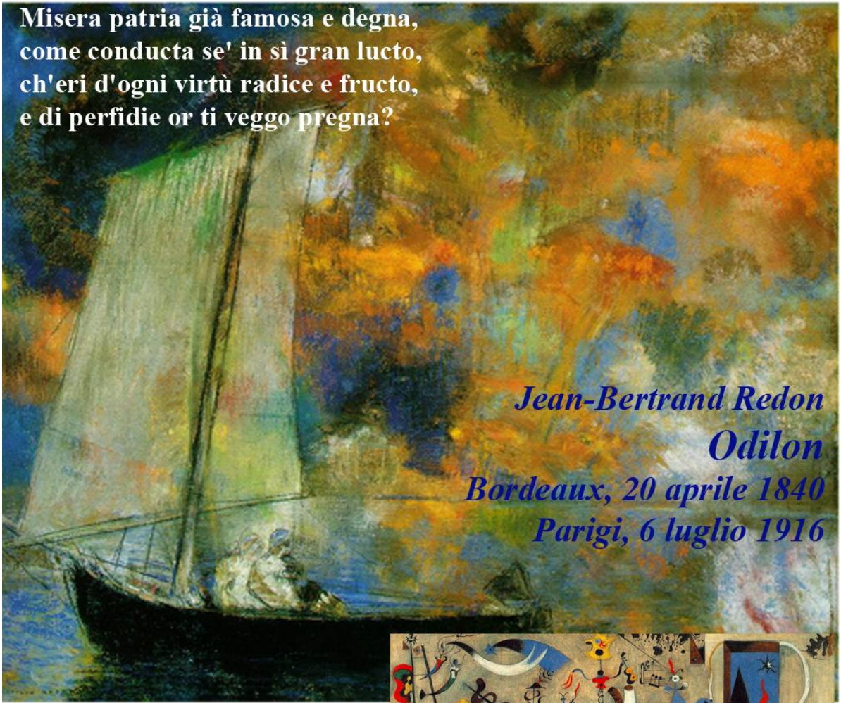
Jean-Bertrand Redon Odilon Bordeaux, 20 aprile 1840 Parigi, 6 luglio 1916

Misera patria già famosa e degna, come conducta se' in sì gran lucto, ch'eri d'ogni virtù radice e fructo, e di perfidie or ti veggo pregna?