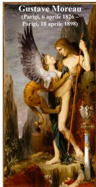
Gustave Moreau (Parigi, 6 aprile 1826 – Parigi, 18 aprile 1898)

NON SOLO MUSICA - NOT ONLY MUSIC Ricordiamo oggi anche - Today we remember also Gustave Moreau (Parigi, 6 aprile 1826 – Parigi, 18 aprile 1898) Luigi Spazzapan (Gradisca d'Isonzo, 18 aprile 1889 – Torino, 18 febbraio 1958)