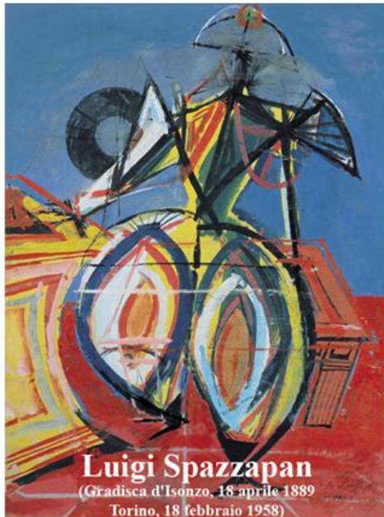
Luigi Spazzapan (Gradisca d'Isonzo, 18 aprile 1889 Torino, 18 febbraio 1958)