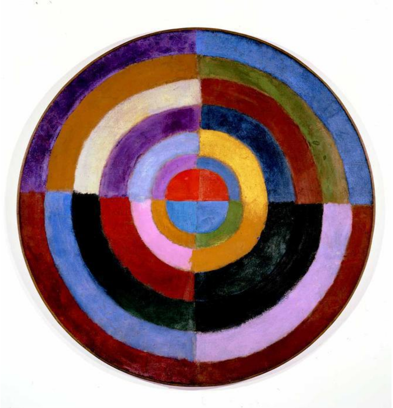
Robert Delaunay (Parigi, 12 aprile 1885 – Montpellier, 25 ottobre 1941)

http://www.treccani.it/enciclopedia/robert-delaunay/