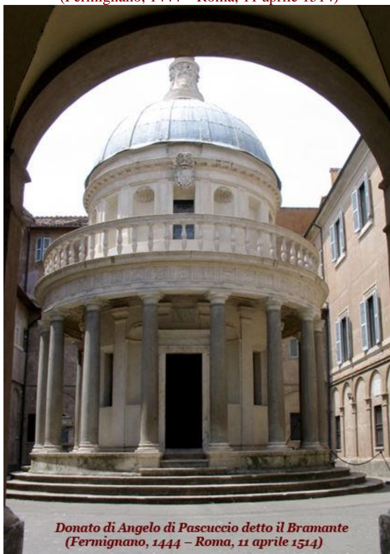
Donato di Angelo di Pascuccio detto il Bramante (Fermignano, 1444 – Roma, 11 aprile 1514)

Donato di Angelo di Pascuccio detto il BRAMANTE (Fermignano, 1444 – Roma, 11 aprile 1514)