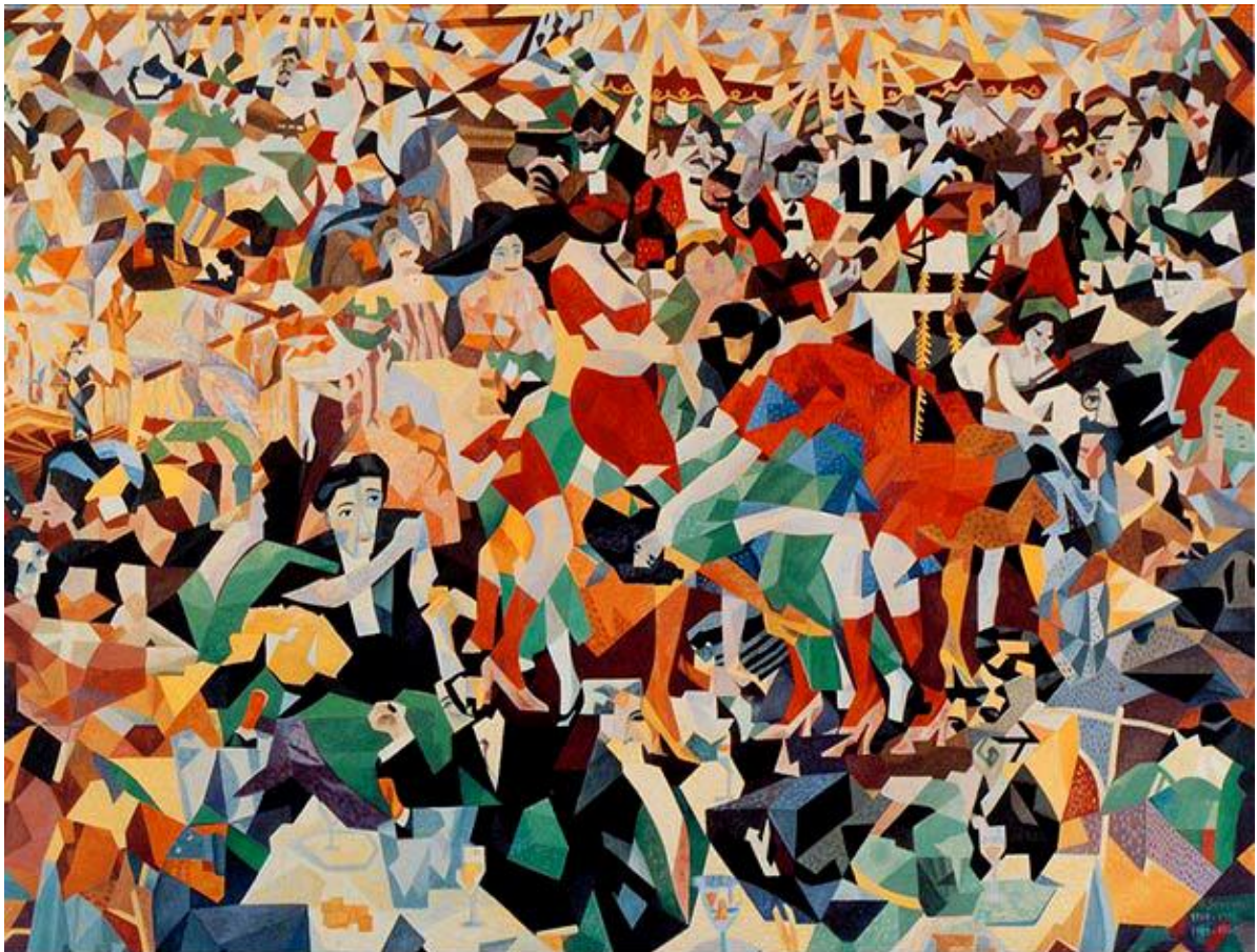
Gino Severini (Cortona, 7 aprile 1883 – Parigi, 26 febbraio 1966)