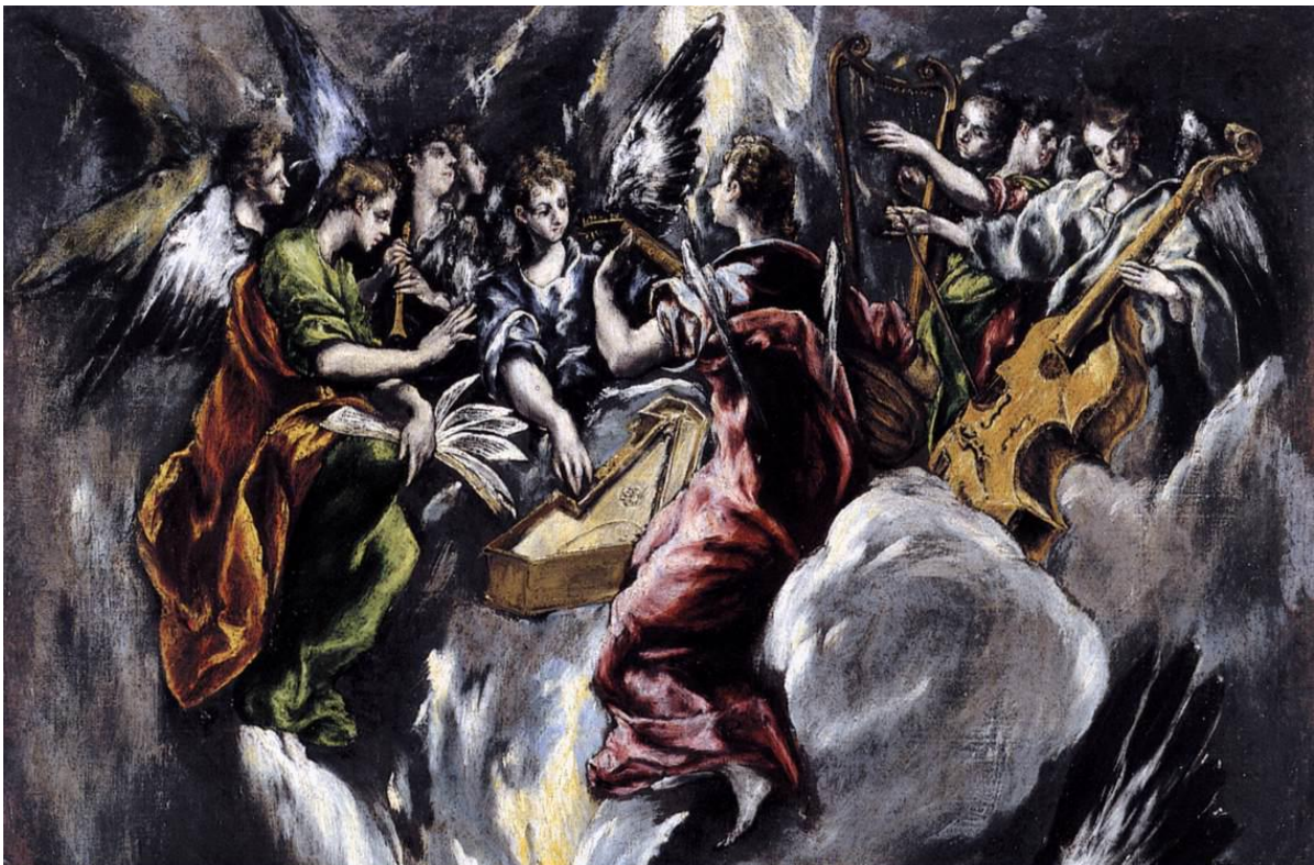
El Greco, Dominikos Theotokopoulos (Candia, 1541 – Toledo, 7 aprile 1614)

Guillaume Dufay, Charles Burney, Johann Sebastian Bach, Wolfgang Amadeus Mozart, Ludwig van Beethoven, Felix Mendelssohn, Mikhail Glinka, Johannes Brahms, Pëtr Il'ič Čajkovskij, Johannes Brahms, Edward Elgar, Giuseppe Verdi, Richard Strauss, Karol Szymanowski, Carl Nielsen, Manuel de Falla, Arthur Honegger, Bohuslav Martinu, Alberto Ginastera, Paul Hindemith, Krzysztof Penderecki, Iannis Xenakis