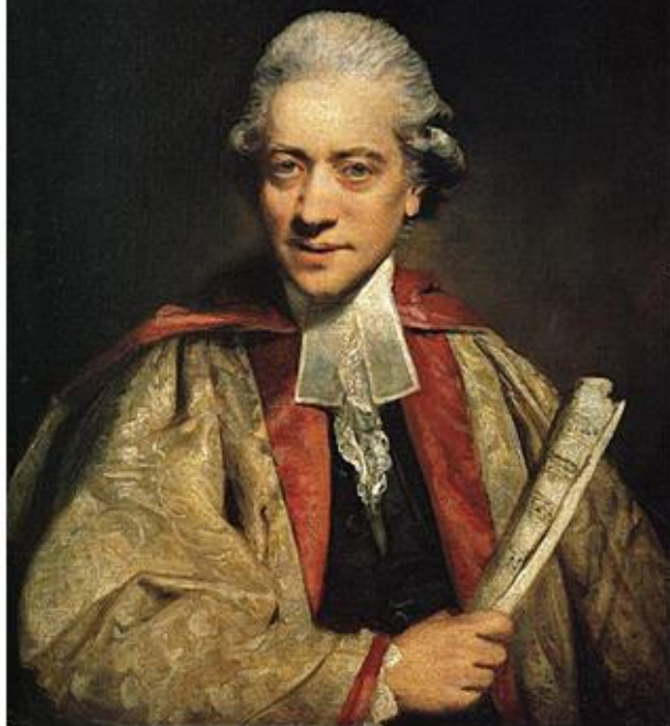
Charles Burney (Shrewsbury, 7 aprile 1726 – Chelsea, 12 aprile 1814)