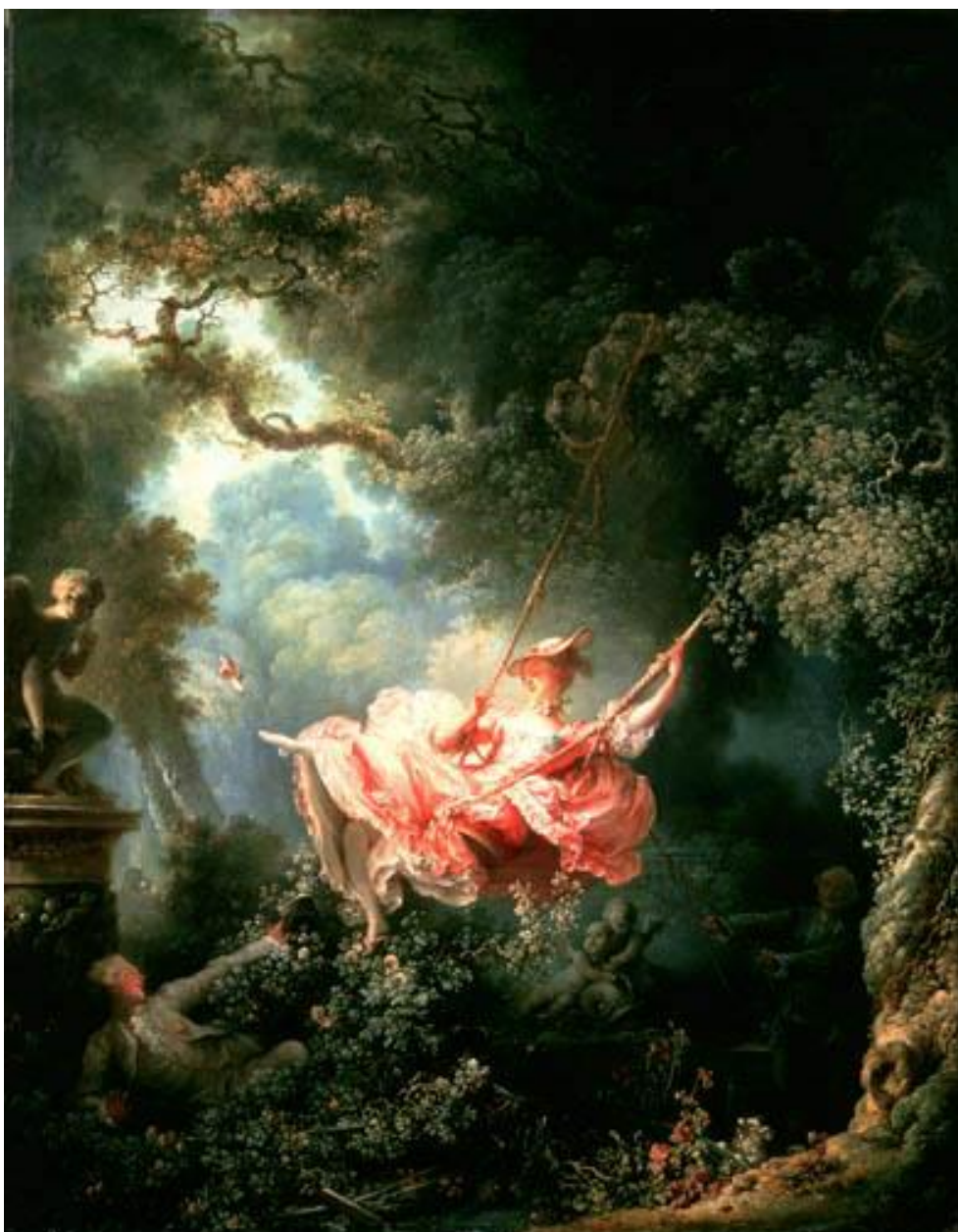
Jean-Honoré Fragonard (Grasse, 5 aprile 1732 – Parigi, 22 agosto 1806)

ESO Edizioni Seghizzi Online & Galleria d'Arte "Seghizzi" & CeRiDo