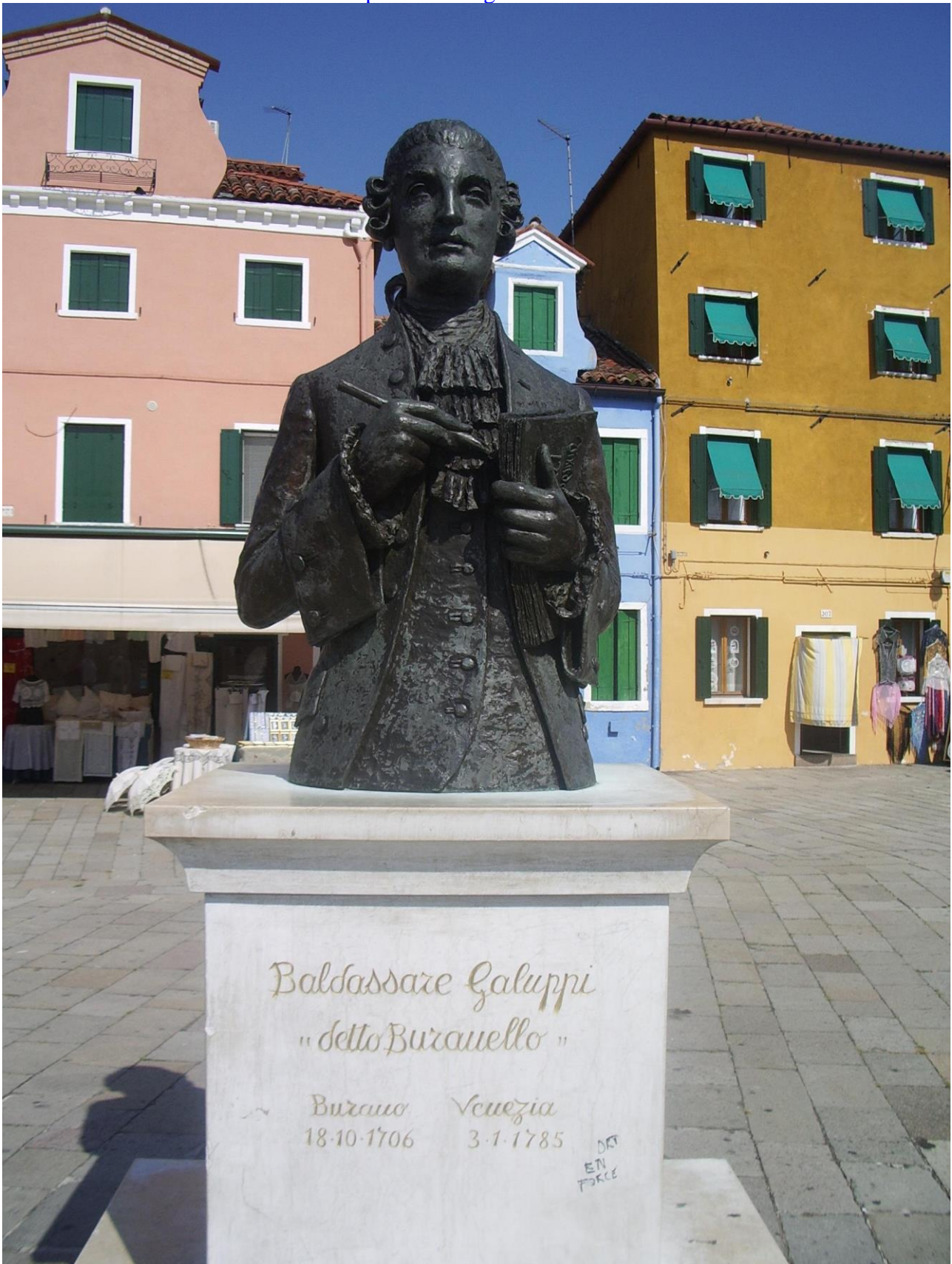
Baldassare Galuppi -da L'olimpiade - Aria di Argene - Son qual per mar turbato https://youtu.be/Z3eUFbKwtOw

(Burano, 18 ottobre 1706 – Venezia, 3 gennaio 1785) compositore e organista italiano